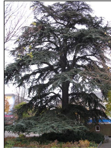
Клоните лежат почти в една равнина