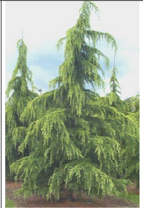
Увиснали надолу клони (върхове на клоните)