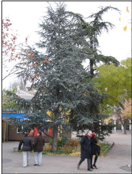
Възходящи (под остър ъгъл) клони